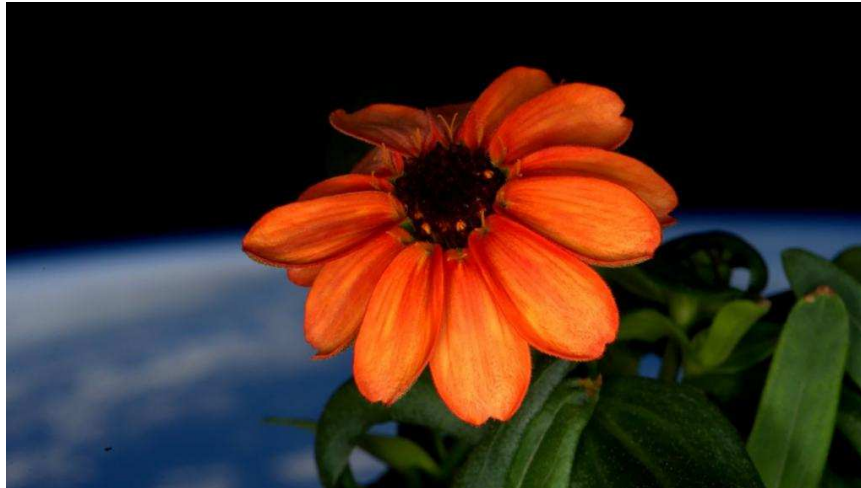
Photographié par l'astronaute Scott Kelly, le zinnia orange, première fleur cultivée dans l'espace, a éclo à bord de l'ISS, le 17 janvier 2016.

Cette première éclosion a donné des idées au professeur Nimbus qui est arrivé à faire pousser sur sa planète une fleur dont la corolle possède 259 839 pétales.