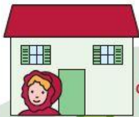
Maison du Petit Chaperon rouge