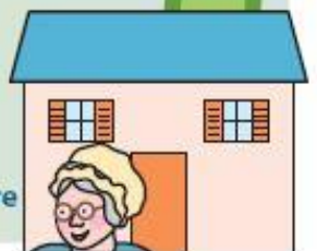
Maison de la grand-mère